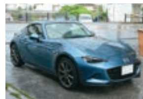
現在所有するのはロードスターRF。「レトロなオープンカーがもともと好き」で、MAZDA車歴はファミリアから始まり、RX-7(FC)を経て、ロードスターは初代から5台乗り継いでいます