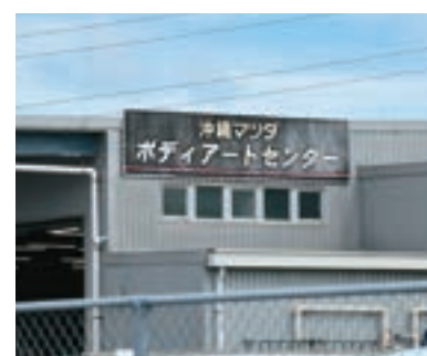
浦添店の一角に建つボディアートセンター

ルの取替に必要な溶接作業も、板金チームが行います。パンパーにはネジがすぐたくさん付いていて、交換だけで2〜3時間かかる車輛もあって大変ですね。それと、事故で衝撃を受けた場合、レーダーセンサーやカメラにズレが起きている可能性もありますから、専用の診断機を用いてズレを調整する「エーミング調整」も実施します。 —センサーに関する情報や器具をマツダから直接得ているメーカー直結だからこそ可能な整備ですね。比：はい。センサーに衝撃を受けた時