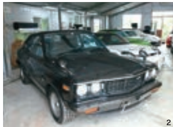
1、堀川さんは趣味でロータリー車のチューニングを手掛けており、ガレージには歴代の貴重なマツダ車が多数並びます。こちらは超貴重な初のロータリーエンジン搭載車「コスモスポーツ」で実走可能 2、サバンナRX-3 V100。国内レース通算100勝を記念して限定発売された貴重なクルマ 3、ゼロヨンレース用に改造したRX-7FD