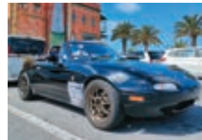
愛車はロードスターNA6。動かなくなって捨てられる寸前だったものを、自分で修理して、ジムカーナでのレンタルにも供しています。「NAの不完全な感じがかわいいんです」