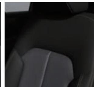
ナッパレザー(タン)/レガーヌ®(タン) 「レガーヌ®」はセーレン株式会社の登録商標です。