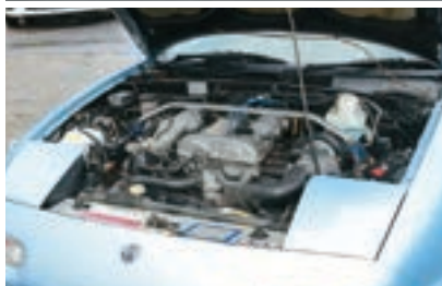
上、競技中の一枚。車体の色は、メーカーの純正色にこだわり、初代デミオの水色をチョイス。ルックスも重視しながら速さも追求 下、NAロードスターはエンジンをNB用の1.6Lに換装。「NAはとにかく軽い！交差点を曲がるだけでも楽しいです」と笑って話してくれました