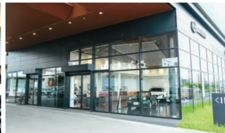
左・ショールームはソファの置かれた居心地のよい空間 右・黒を基調にしたスタイリッシュな外観。沖縄マツダの新世代店舗1号店でもあります